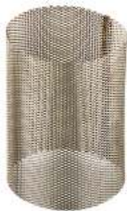
ЭЛЕМЕНТ ФИЛЬТРУЮЩИЙ СЕТЧАТЫЙ

Произведено по технологии: VALTEC s.r.l., Via Pietro Cossa, 2, 25135-Brescia, ITALY Изготовитель: TAIZHOU JIAHENG VALVES CO.,LTD, Huxin Village, Chumen Town, Yuhuan County, China